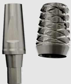
MONCONE CONOMETRICO Senza utilizzo di vite e cemento